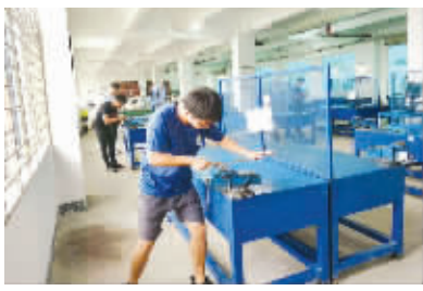
▶▶▶ 详见 T2