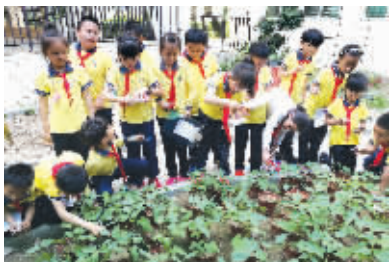
▶▶▶ 详见 T2