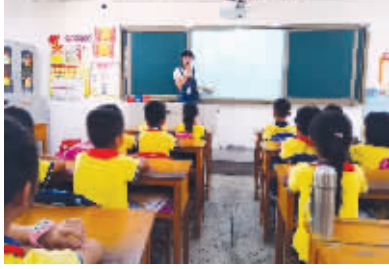
▶▶▶ 详见 T4